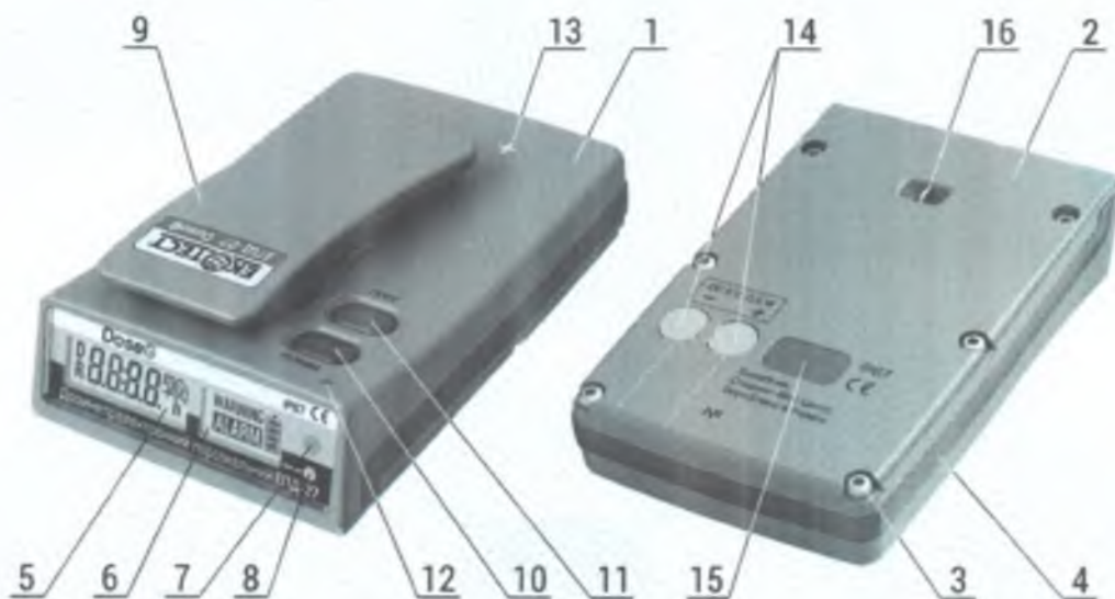
Рисунок 1 – Зовнішній вигляд дозиметра ЕПД-27 «DoseG»

Корпус дозиметра виконаний з ударостійкої склонаповненої пластмаси і складається з двох накривок – верхньої (1) і нижньої (2), з'єднаних гвинтами (3). Верхня накривка (1) модифікації дозиметра ЕПД-27 «DoseGX» містить вставку (17), що є прозора для низькоенергетичного рентгенівського випромінювання. Між вказаними накривками по периметру їх стику розташована виступаюча еластична ущільнююча рамка-прокладка (4). На передньому скошеному торці дозиметра розташований екран з підсвіткою рідкокристалічного індикатора (РКІ), розділений на дві частини (5) і (6) та два світлодіодних індикатори (7) «ТРИВОГА» та (8) «ЗАРЯД». На верхній накривці закріплена кліпса (9) для утримання дозиметра в нагрудній кишені. Поруч з кліпсою розміщені дві кнопки – (10) «РЕЖИМ» та (11) «ПОРІГ», а також світлодіодний індикатор (12) «ТРИВОГА» (дублює індикатор (7)). В задній частині верхньої накривки нанесений знак (13) «+», який показує проекцію геометричного центра детектора, розташованого під накривкою на глибині 7,2 мм. На нижній накривці розміщені дві круглі контактні площадки (14) для підключення зарядного пристрою, вікно (15) для обміну даними з зовнішніми пристроями через інфрачервоний порт та гачок (16) для закріплення нашійного шнура-ремінця у випадку відсутності одягу з нагрудною кишенею.