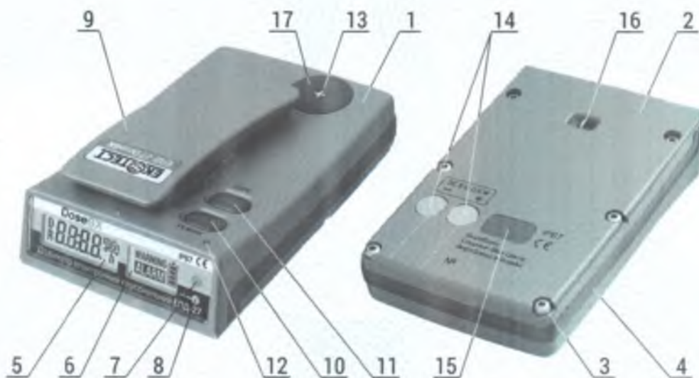
Рисунок 2 – Зовнішній вигляд дозиметра ЕПД-27 «DoseGX»